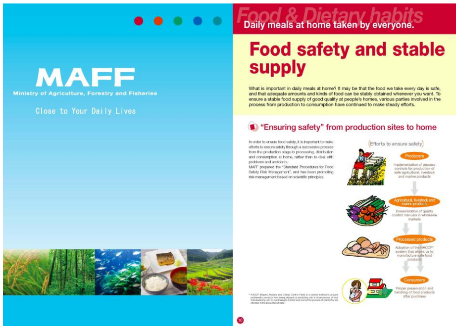
Rycina 1 Okładka i przykładowa strona broszury Ministerstwa Rolnictwa, Leśnictwa i Łowisk